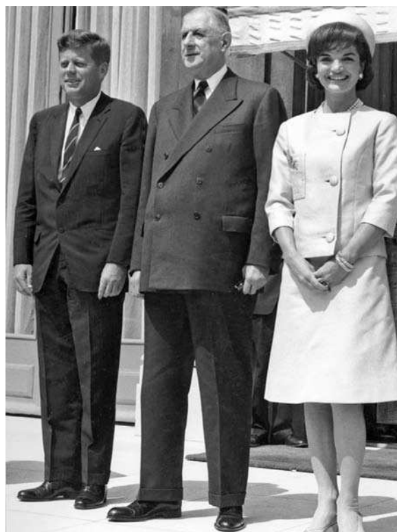
Visite du président Kennedy en France en juin 1961. De Gaulle se montrera un allié indéfectible des États-Unis lors de l'affaire de Cuba en 1962.

avait ouvert une crise internationale majeure, qui a été un des trois ou quatre moments les plus critiques de toute la guerre froide, un des moments où le monde aurait pu basculer dans la guerre nucléaire. La crise a été dénouée grâce à la qualité du renseignement aérien qui apportait à l'opinion internationale des preuves irréfutables de la manœuvre des Soviétiques, et bien évidemment grâce à la réaction politique adéquate du président Kennedy, soutenu dès le premier instant par le général de Gaulle. À ce propos, il me paraît intéressant de rappeler que le général de Gaulle s'était montré offusqué de l'insistance des Américains à venir à Paris lui présenter les « preuves ». Il faisait confiance au Président américain, au Président du pays qui avait toujours été l'ami de la France.