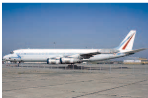
DC-8 SARIGUE (Système aéroporté de recueil d'informations de guerre électronique), avion d'écoute retiré du service en 2004.

Le renseignement aérospatial a toujours été un domaine d'excellence des forces aériennes françaises car nous avons consenti l'effort nécessaire, dès la fin des années 1950, pour les doter d'une capacité autonome d'appréciation de situation conforme à nos ambitions politiques. Ces capacités ont sans cesse été améliorées jusqu'au milieu des années 1990, grâce à la modernisation des capteurs et des moyens de traitement des informations, grâce également à la mise en service du satellite d'observation Hélios et des écoutes spatiales. Malheureusement, elles ont été réduites au début des années 2000 avec le retrait du service de l'avion d'écoute stratégique DC-8 SARIGUE et des Mirage IV de reconnaissance. Les capacités aériennes actuelles – Mirage FICR et Super-Étendard – sont vieillissantes et ne sont pas dotées de capacités tout temps et temps réel. Elles ne sont plus cohérentes avec les besoins croissants et diversifiés d'information et de renseignement qui sont les nôtres. Nous sommes entrés dans une ère de déficit capacitaire croissant, comme on l'a vu dans certaines situations que je viens de rappeler.